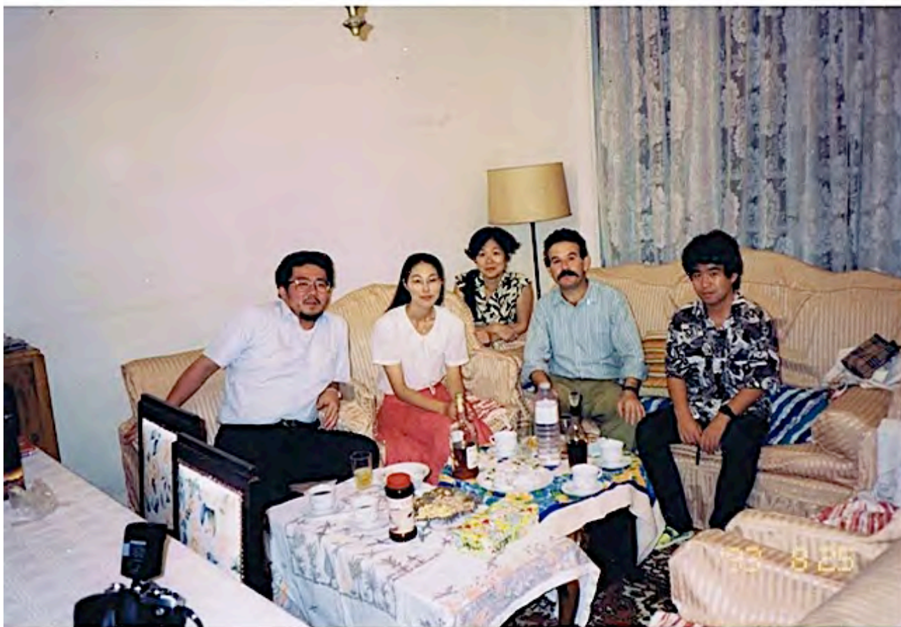
* 自宅のリビングにて In the living room

In 1981, Egyptian President Sadat was assassinated and replaced by President Mubarak. 10 years later, in 1990-91, the Gulf War took place. In 1992, Cairo was famously hit by a major earthquake, and search-and-destroy operations targeting radical Islamists were carried out. Nevertheless, in light of current uncertainty about the future, there were also some hopeful events. The Oslo Accords were signed. Nelson Mandela won a Noble Peace Prize. And the Maastricht Treaty came into effect, giving a green light to the European Union